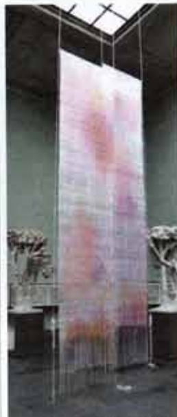
Aurora Passeros stedsspesifikke verk Positions samtaler med både Vigelands fonteneskulpturer og museets arkitektur. Kunstnerens spindelvestynne tepper har et klart feminint preg, i kontrast til den øvrige maskuliniteten.