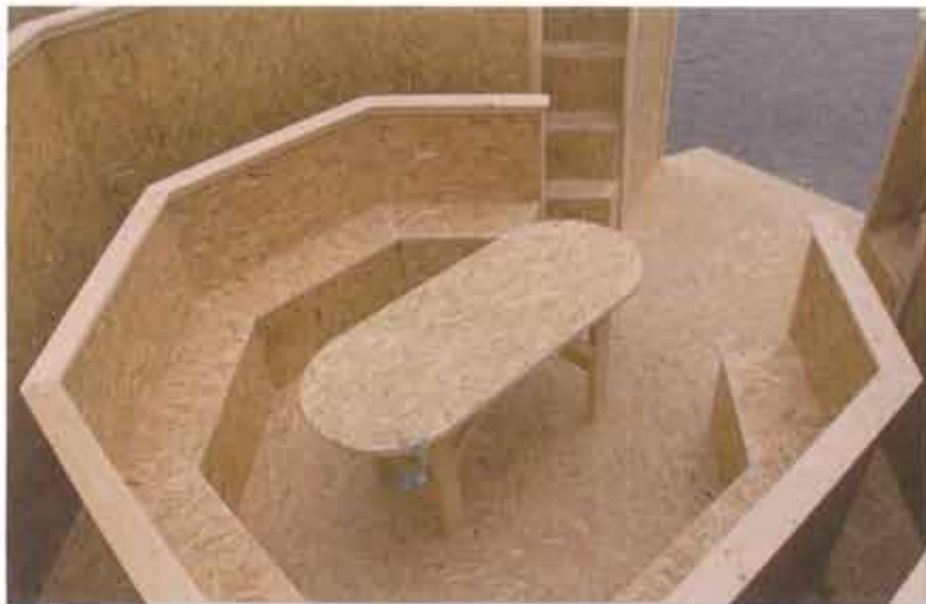
Petrine Lillevold Vinje, Anatomisk Teater .