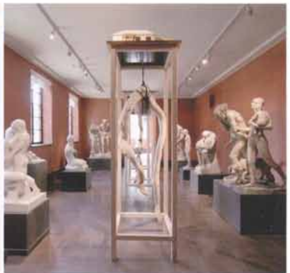
Mattias Härenstam, Sketches for a re-animation I (... everything is different now, but it still feels the same) . Foto: Mattias Härenstam.